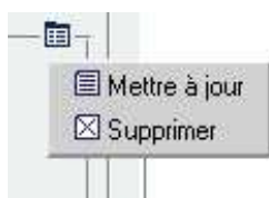
Illustration 4 : Icônes d'édition

Vous pouvez maintenant accéder aux fonctions d'édition clés (petites icônes – cliquez sur l'icône en haut à droite d'un bloc pour que ses fonctions associées apparaissent).